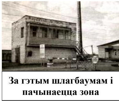
За гэтым шлагбаумам і пачынаецца зона

26 красавіка – Дзень Чарнобыльскай трагедыі